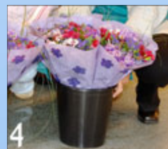
Disimballare il secchio in una scatola