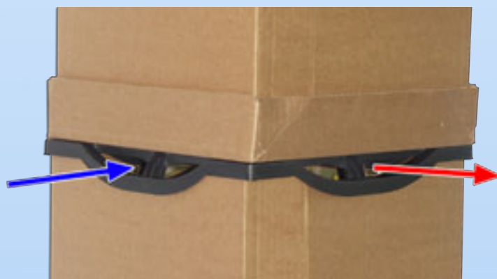
La ventilazione in un pallet con imballaggi Miami

Il coperchio dell'imballaggio Miami è provvisto di fori di ventilazione ai lati e sulla parte superiore. Quando l'imballaggio viene impilato il lati del coperchio rimangono aperti e l'aria umida può uscire dall'imballaggio mentre l'aria fresca può entrare. Una buona ventilazione vuole dire meno possibilità di Botrite ed una temperatura inferiore nell'imballaggio. Quindi si mantiene meglio la qualità dei fiori.