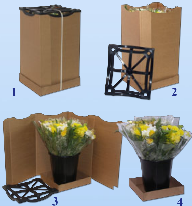
Come disimballare l'imballaggio per fiori Miami