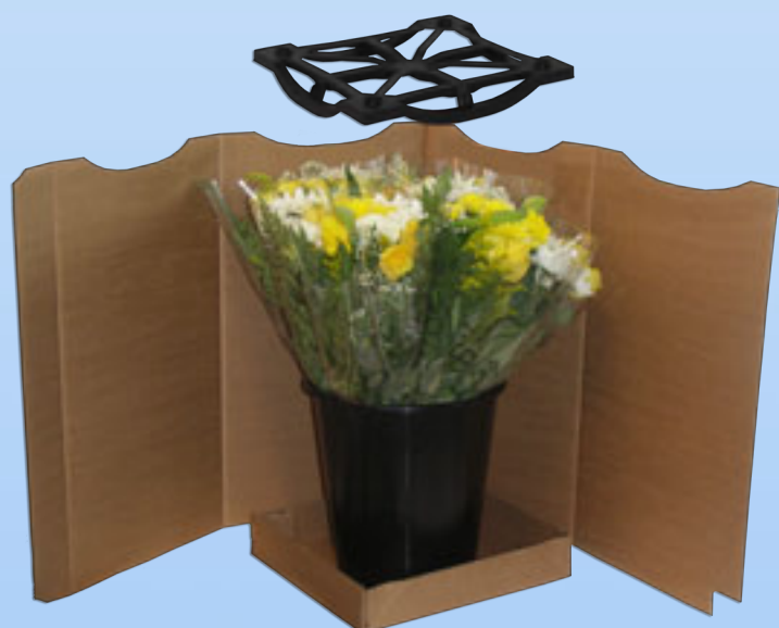
Gli elementi di un imballaggio Miami